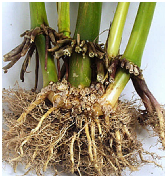
Wurzelwerk einer Maispflanze aus dem Jahr 2006. Bauern meinten, dafür seien fünf Körner in die Erde gelegt worden. Mitnichten. Ein Samenkorn genügte für dieses prächtige Wachstum. Es wurde mit konzentrierter kosmischer Energie aus einem Konusgenerator aufgeladen.