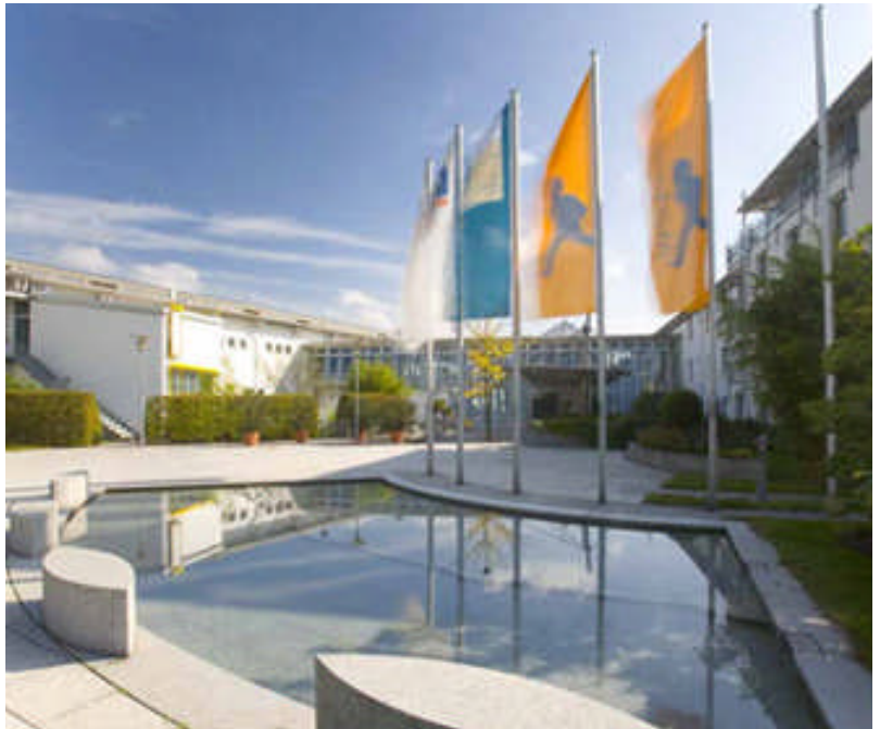
Blick auf das Akademie-Hotel in Karlsruhe.

Die Akademie ist verkehrsgünstig gelegen und mit dem Auto und der Bahn bequem und schnell erreichbar: Per Auto über die A 5 von Frankfurt und Basel oder über die A 8 von Stuttgart aus. 140 Parkplätze in der Tiefgarage und zusätzlich 60 Parkplätze im Freien stehen zur Verfügung.