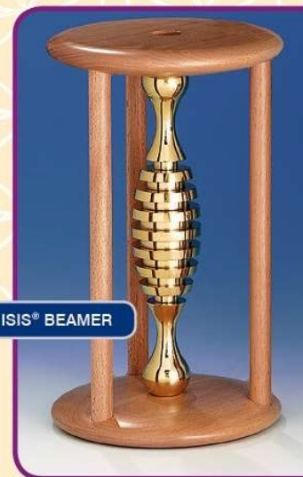
WEBER ISIS® BEAMER

Harmonisierung möglich bei aller Art von Strahleneinflüssen