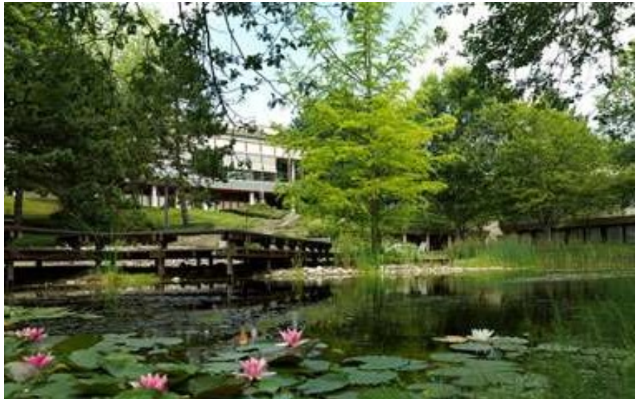
Wunderschöne Lage im Taunus: das Kongress- und Tagungszentrum KTC Königstein.

Seine exponierte Lage am Rande eines Naturschutzgebietes macht das KTC Königstein zum idealen Standort, ist es doch ruhig und idyllisch gelegen, und doch nur wenige Autominuten von Frankfurt, Wiesbaden und Mainz entfernt. Das Zentrum umfasst 218 Gästezimmer zu