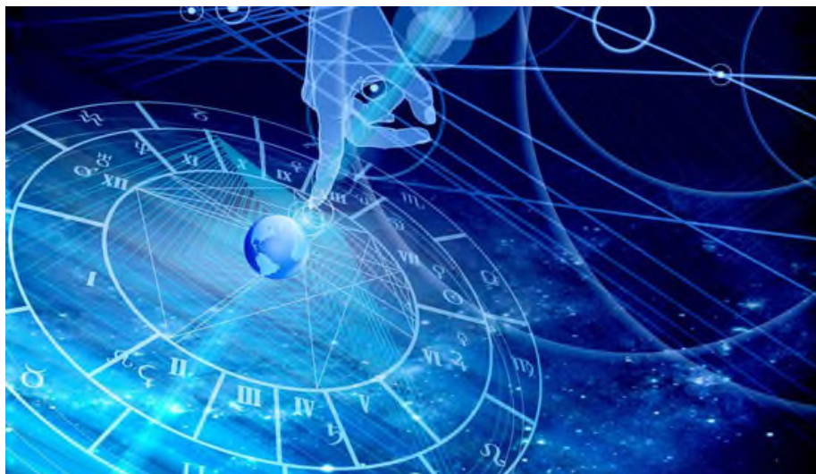
Was bringt die Zukunft? Astrologen versuchen, etwas hinter die Kulissen des kosmi-

Er ist auch jeweils auf Mineralmessen präsent und fasziniert dort durch Vorträge. Tatsächlich gibt es auf seiner Webseite begeisterte Zeugenberichte 2 von Lesern des Börsenbriefs, die wirtschaftlich profitiert haben, indem sie die Empfehlungen befolgten.