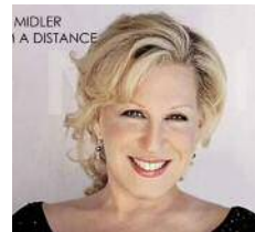
Bette Middler singt den Song “God is watching you” auf: http://www.youtube.com/watch?v=aDSh5wUtXt4

“And it's the hope of hopes, it's the love of loves, it's the heart of every man. It's the hope of hopes, it's the love of loves. This is the song of every man. And God is watching us, God is watching us, God is watching us from a distance.