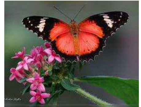
Beispiel der Metamorphose: Aus der vollgefressenen Raupe entpuppt sich nach einigen Tagen ein Schmetterling.

Die Frage, was der Einzelne tun könne, beantwortet er unter anderem damit: “Macht Technologien der Freien Energie bekannt; setzt Euch dafür ein, dass Rettungsaktionen für Banken gestoppt und dass unabhängige Banken geschaffen werden; nutzt regionale Banken; unterstützt unabhängige Medien; engagiert Euch für ein Versicherungswesen, das Ärzte dafür bezahlt, dass sie die Leute gesund erhalten” usw.