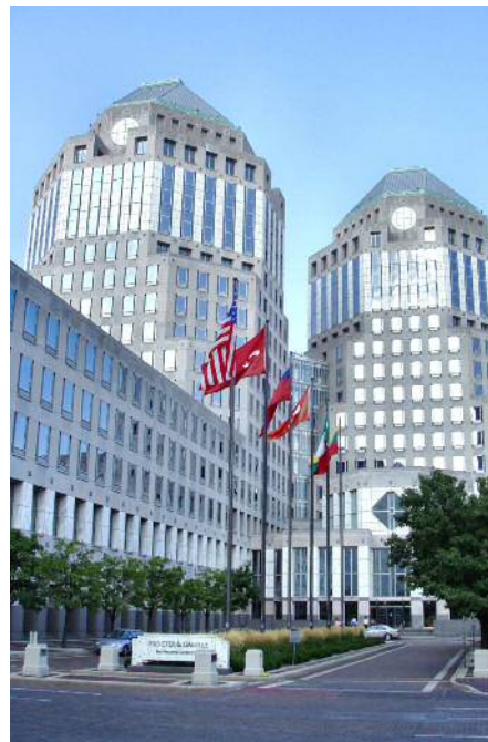
Hauptsitz von Procter & Gamble in Cincinnati/Ohio.

Foster Gamble, ein “Insider”, wie er im Buche steht, der die Spielregeln dieser Welt als Abkömmling des Procter & Gamble-Konzerns kennt und der aufzeigt, wie ihnen zu entkommen ist: Foster Gamble, hier zu sehen mit der Torusform als Symbol für Harmonie und Aufbau, die das ganze Universum prägt.