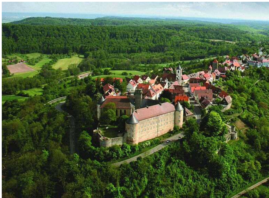
Das Umweltmuseum Waldenburg im Vordergrund; das Hotel ist auf diesem Bild nicht zu sehen, befindet sich aber nur 500 km entfernt vom historischen Ortskern.

Doppelzimmer kosten 115 Euro, Einzelzimmer 80 Euro.