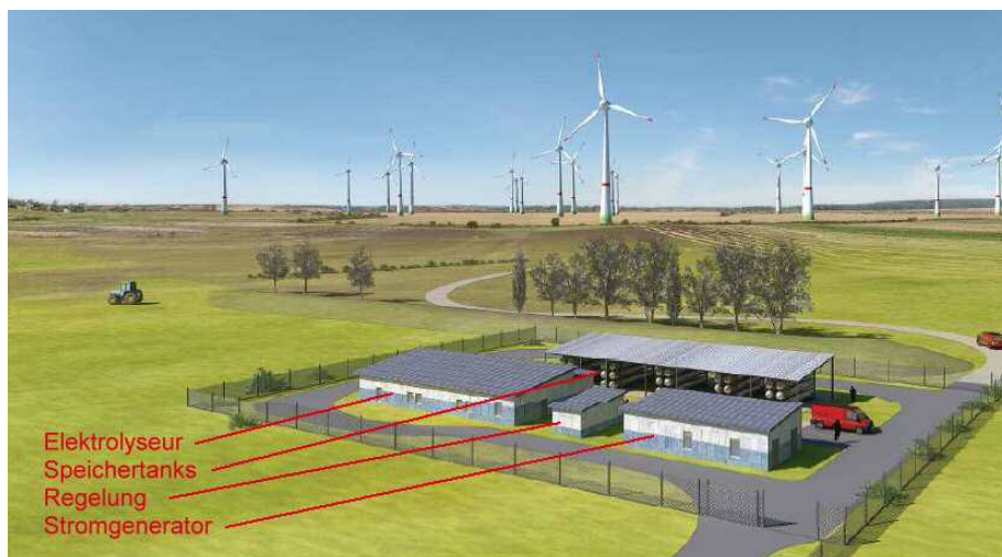
Bild 1: Windpark mit Wasserstoff-Energiespeicherung.

Für eine höhere Energiedichte im Speicher, wie z.B. in einem Fahrzeug erwünscht, ist ein Druck von 700 bar heute Standard. Um diesen Druck zu erzeugen, werden spezielle Pumpen in Kaskaden mit Gaskühlung dazwischen eingesetzt (cryo pump). Das Gas (GH2 = Gaseous Hydrogen) kann dann bei normaler Umgebungstemperatur in speziellen Hochdrucktanks gelagert und z.B. in Fahrzeugen transportiert und genutzt werden. Eine viel größere Dichte kann erreicht werden, wenn der Wasser-