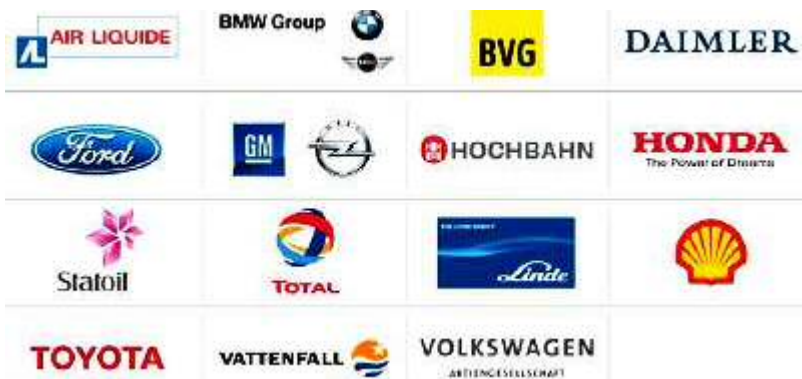
Bild 4: Firmen, die an Wasserstofftechnik beteiligt sind.

erneuerbaren Energien werden. Sie böte jetzt schon jene Speicher- und Transportkapazitäten, die dem Stromnetz fehlen. Eine Verwertung von Stromerzeugungsspitzen könnte also durch diese Technik kurzfristig realisiert werden, und der Aufbau einer parallelen Wasserstoffinfrastruktur wäre weitgehend verzichtbar 7 .