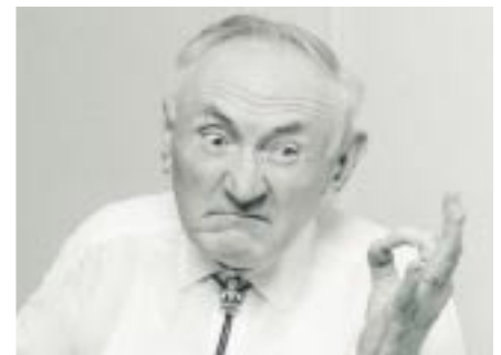
FRITZ ZWICKY STIFTUNG, GLARUS, SCHWEIZ