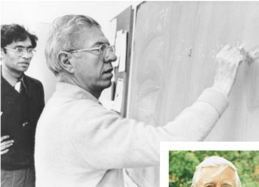
MIT FRDL. GEN. VON CHANDRA WICKRAMASINGHE, AUS: A JOURNEY WITH FRED HOYLE, 2005

Schauen wir zunächst auf die Rotverschiebung, die vom Standardmodell so schön einleuchtend durch die Expansion des Universums erklärt wird. Auf einige Beobachtungen zur Rotverschiebung benachbarter Objekte stützt sich die Kritik, die der Astronom Halton Arp, derzeit freier Mitarbeiter des Max-Planck-Instituts für Astrophysik in Garching, dem Standardmodell entgegenbringt. Diese »anomale« Rotverschiebung findet sich bei Galaxien und Quasaren (oder Galaxienpaaren), die scheinbar durch Filamente miteinander verbunden sind, aber dennoch deutlich unterschiedliche Rotverschiebungen aufweisen. Ein auch von Arp immer wieder gern angeführtes Beispiel für dieses Phänomen sind die Galaxie NGC4319 und der Quasar Markarian 205 (Foto rechts). Beide Objekte scheinen miteinander verbunden zu sein, dennoch weist die Galaxie eine Rotverschiebung von 0,005 auf, wohingegen der Wert des Quasars bei 0,07 liegt.