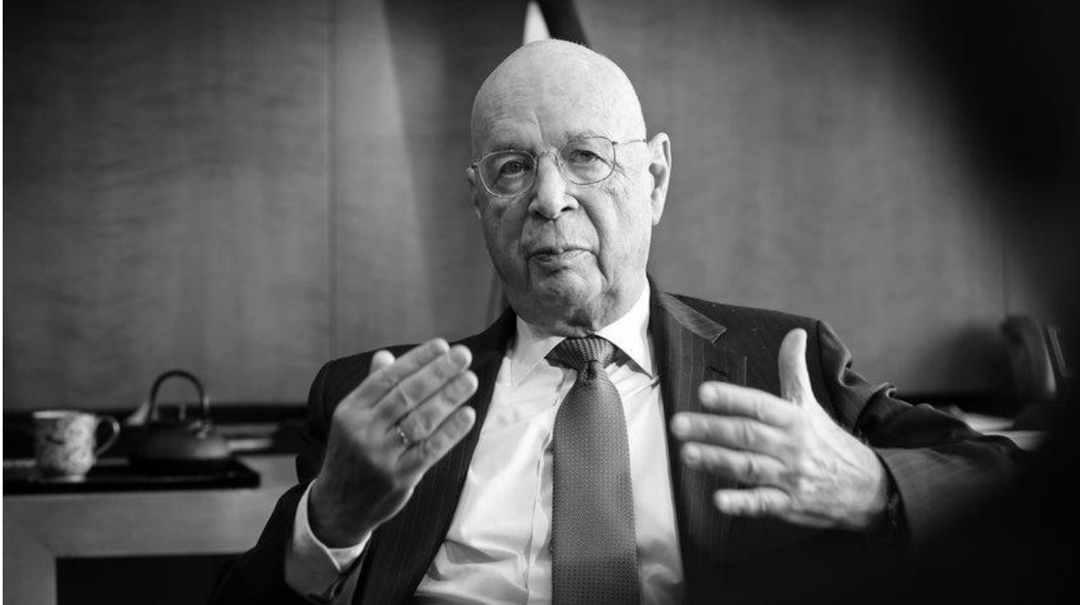
Klaus Schwab, Chef des Weltwirtschaftsforums